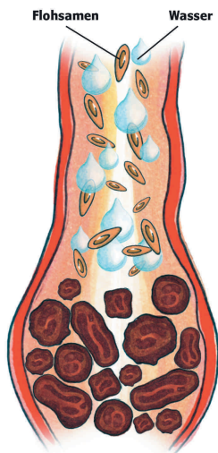
Zu harter, fester Stuhl

Flohsamen quellen in Verbindung mit reichlich Flüssigkeit rasch auf und bilden um die Samen eine transparente gallertartige Schicht.